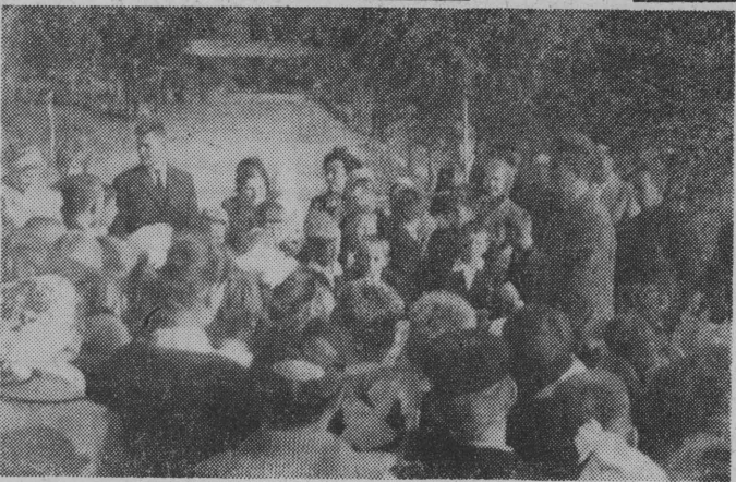
NA ZDJĘCIU: moment przekazania do użytku nowej drogi w Oldakach.

Samych wykładówce cechuje także dążenie do uzupełniania swej wiedzy. Świadczą o tym kontakty z placówkami naukowymi całej Polski oraz wymiana doświadczeń z innymi podobnymi zakładami. (zb)