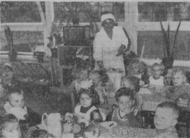
Takie wszystko smaczne, że tylko „paluszki” liczyć.