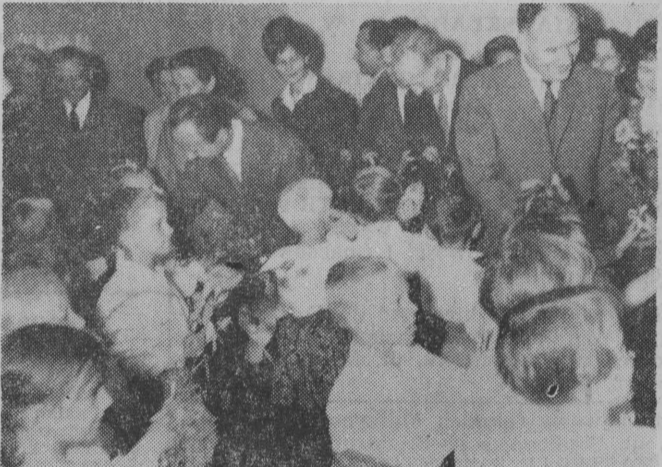
Gości witano kwiatami.