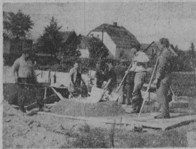
NA ZDJĘCIU: mieszkańcy Sztabiny w czynnie społecznym zakładają fundamenty pod nowy sklep.

Na tym bynajmniej nie skończy się udział pow. oleckiego w podziale funduszy SFOS-owskiego. Obecnie bowiem przeznaczono 5,5 mln zł na zakończenie budowy domu kultury i wyposażenie jego wnętrza, zaś w latach 1967-1968 wybudowane zostaną dwa wiejskie ośrodki zdrowia, kosztem 2,4 mln zł. (sg)