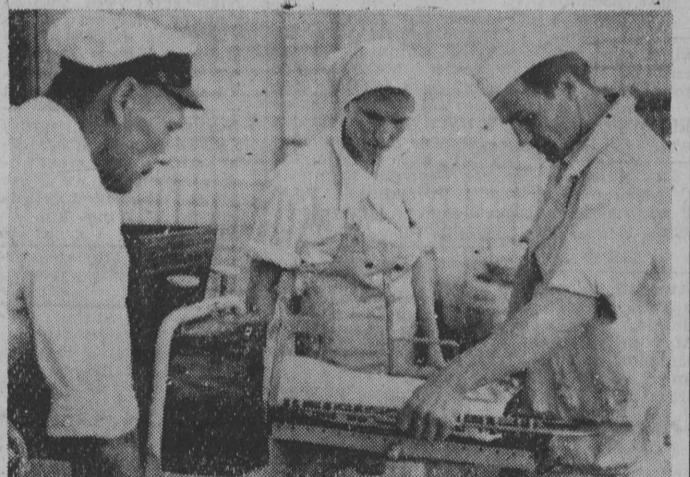
Porcjowanie masła odbywa się w sposób dość prymitywny. Ale porcuje się tylko niewielkie ilości na potrzeby Siemiatycz. Reszta produkcji opuszcza zakład w specjalnych beczkach.