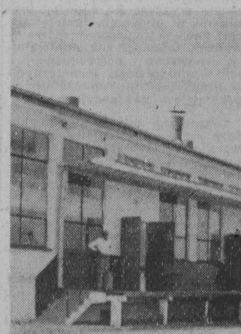
NA ZDJĘCIU: każdego ranka trafiają do mleczarni siemiatyckiej tysiące litrów mleka z wiejskich zlewni.

W Siemiatyczach oddano niedawno do użytku nowoczesny Zakład Mleczarski. Zatrudnia on ok. 100 osób i przerabia ok. 30 tysięcy litrów mleka dziennie.