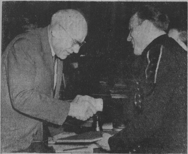
NA ZDJĘCIU: górnicy z kopalni „Bolesław Śmiały” wręczają tow. Władysławowi Gomulce album — pamiątkę z pobytu w tejże kopalni na uroczystościach barburkowych w 1963 r.