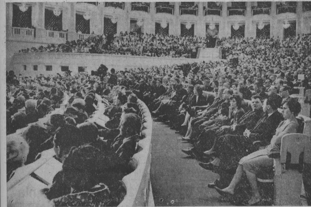
ZA ZDJĘCIU: fragment sali obrad.