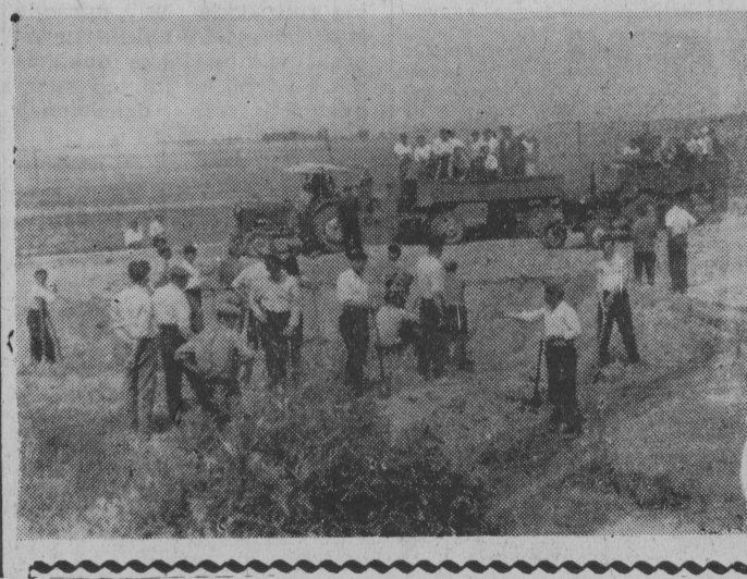
NA ZDJĘCIU: fragment budowy drogi w Starym Korwinie.