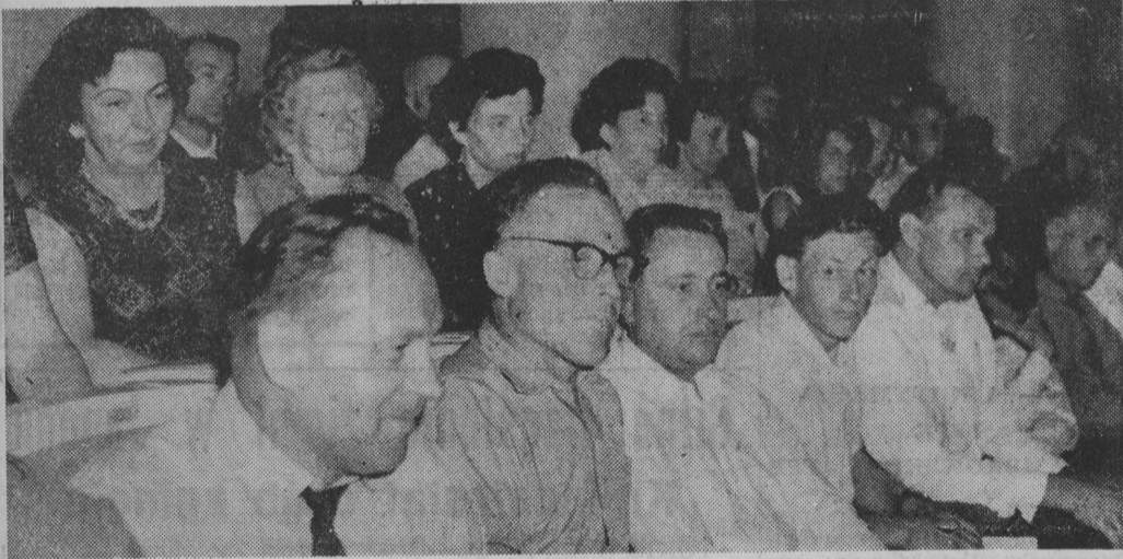
NA ZDJĘCIU: na sali obrad delegaci woj. białostockiego.