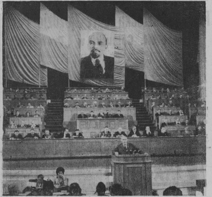
NA ZDJĘCIU: Prezydium. Przemawia Władysław Gomułka.

WARSZAWA (PAP) — W kulturalnych IV Zjazdach partii Centralna Agencja Fotograficzna zorganizowała w ramach czynu zjazdowego wystawę pod nazwą „Kraj, ludzie i ich dzieło”. Wystawa obrazuje dorobek Polski Ludowej we wszystkich dziedzinach życia. Ponad 130 wielkich plansz fotograficznych stanowi wymowną ilustrację też zjazdowych, obrazując osiągnięcia gospodarcze, socjalne i kulturalne powojennego XX-lecia.