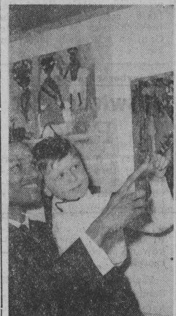
W październiku ub. roku Towarzystwo Przyjaźni Polsko-Afrykańskiej i Kuratorium Okręgu Szkolnego m. st. Warszawy ogłosiło konkurs plastyczny pn. „Afryka w oczach dziecka”.