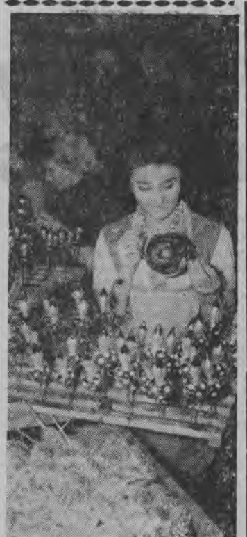
W wyłudniach trwa praca przy produkcji świecidełek choinkowych. Popyt na nie jest ogromny zarówno w kraju jak i za granicą.

Ciąg dalszy ze str. 3... że najlepsze nawet system planowania nie jest w stanie przewidzieć w toku układania planów wszystkich zjawisk, które w przyszłości mogą mieć wpływ na sytuację gospodarstwa kraju.