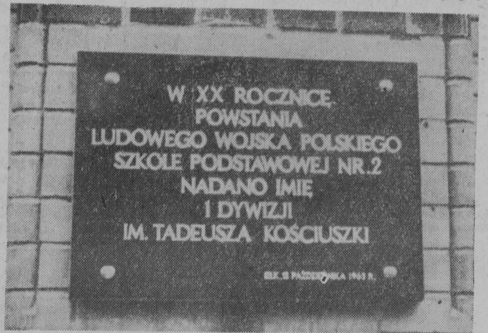
Tablica pamiątkowa, wmurowana w ścianę budynku szkolnego.