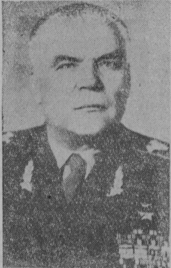
Marszałek Rodion Malinowski.

WARSZAWA (PAP) — Na zaproszenie Komitetu Centralnego Polskiej Zjednoczonej Partii Robotniczej i rządu PRL, przekazane przez członka Biura Politycznego KC PZPR, ministra Obrony Narodowej — Marszałka Polski Mariana Spychalskiego