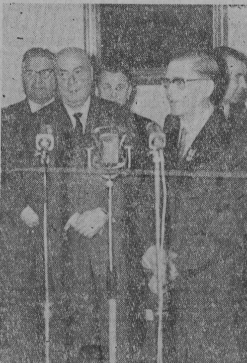
NA ZDJĘCIU: w czasie uroczystości przemawia przewodniczący Rady Państwa A. Zawadzki.

WARSZAWA (PAP) — Jak już podawaliśmy, 9 bm. z okazji XX-lecia Ludowego Wojska Polskiego przewodniczący Rady Państwa Aleksander Zawadzki wręczył ministrowi Obrony Narodowej, Marszałkowi Polski, Marianowi Spychalskiemu akt nominacji na Marszałka Polski.