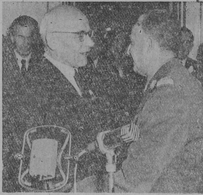
NA ZDJĘCIU: I sekretarz KC PZPR Władysław Gomułka składa gratulacje Marianowi Spychalskiemu.

WARSZAWA (PAP) — Na zaproszenie Komitetu Centralnego PZPR i rządu PRL w trzeciej dekadzie bm. przybędą z wizytą do Polski radzieccy kosmonauci Walentyna Tierieszkowa i ppłk Walery Bykowski. W czasie tygodniowego pobytu w Polsce kosmonauci spotkają się ze społeczeństwem stolicy i innych ośrodków kraju.