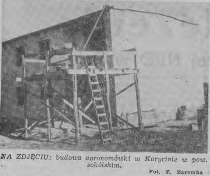
NA ZDJĘCIU: budowa agronomiki w Koryfcinie w pow. sokólskim.