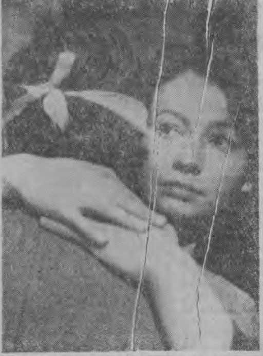
Na ekrany kin w całej Polsce wszedł nowy film polski „Mileczenie”