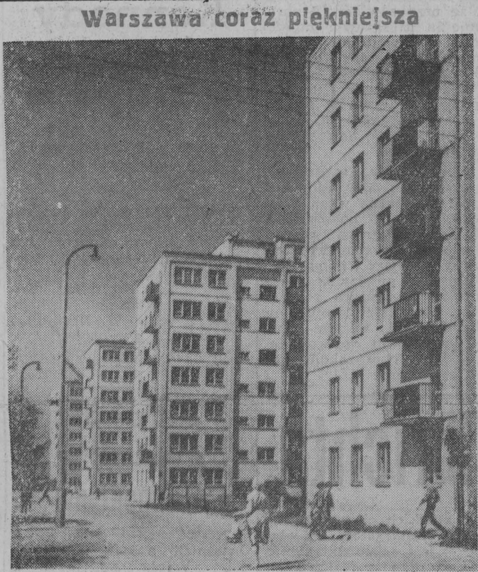
Warszawa coraz piękniejsza