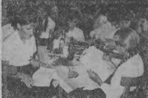
Szkolę nr 23 ukończyło w tym roku 94 absolwentów — wszyscy uczniowie klas siódmych. Teraz absolwentki oglądają świadectwa i nagrody książkowe.

A uczniowie innych klas ostatnie dni przed zakończeniem roku szkolnego wykorzystali na przyjemne wycieczki. Spółdzielnia Turystyczna - Wypoczynkowa „Gromada” dla 200 uczniów najmłodszych klas ze Szkoły Podstawowej nr 4 zorganizowała wycieczkę na lotnisko. Młodzież z zainteresowaniem oglądała szybowce i samoloty, słuchała objaśnień instruktorów, podziwiała loty. Potem odbył się przyjemny wypoczynek w pobliskim lesie. (a)