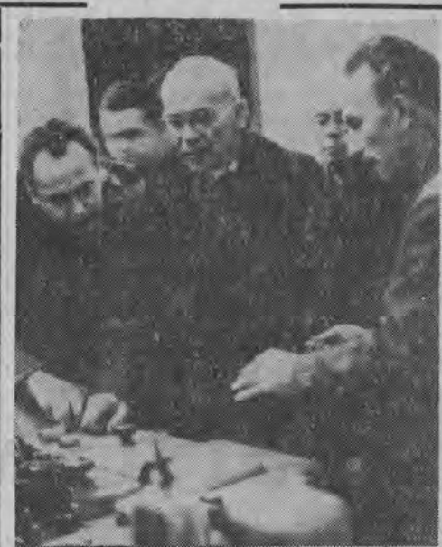
Władysław Gomułka zwiedził w Berlinie w dniu 19 bm. wystawę osiągnięć NRD.