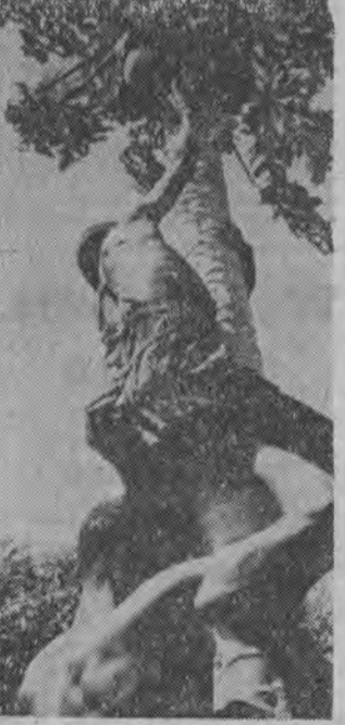
Republika Górnej Wolicy. Owoc drzewa melonowego są doskonałe, ale ich zbiór — jak to widać na zdjęciu — jest skomplikowany.