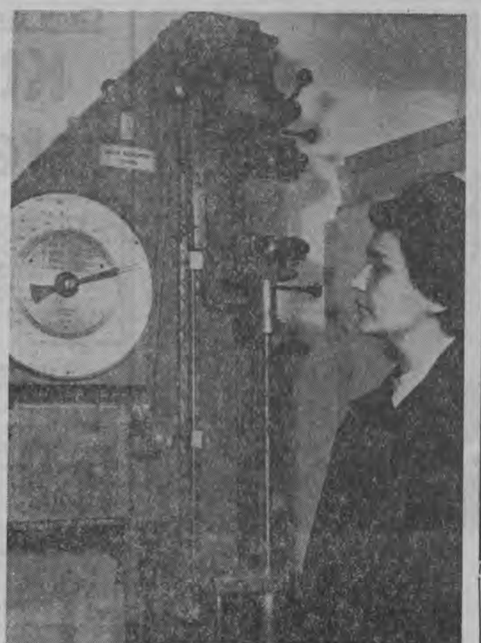
Z osiągnięć naukowców Instytutu Przemysłu Włókien Łykowych w Poznaniu korzysta nie tylko krajowa przędzalniczo i włókiennicza, Instytut staje się również coraz poważniejszym eksportem opracowań technicznych. Dokumentacje obiektów przemysłowych wraz z opracowaniami kompletnych urządzeń i technologii przerobki włókien tykowych zakupują w ZSRR, Chin, Czechosłowacji, NRD, Węgry i Rumunię. Inną działalnością Instytutu jest hodowla wysokowiskoosiwośći odmian lnu i konopi. Dzięki temu będzie można potocznie zmniejszyć import tych nasion.

W tym miejscu warto podkreślić, że w związku z rozwijaniem produkcji eksportowej, zakład boryka się z dużymi trudnościami. Odczuwa się brak odpowiedniej ilości narzędzi do obróbki imadła. Nie można także znaleźć przedsiębiorstwa, które wykonałyby specjalną, przemysłową instalację elektryczną. Sprawa ta ciągnie się już od wielu miesięcy. Z pomocą w rozwiązaniu tych problemów powinno przyjść zjednoczenie.