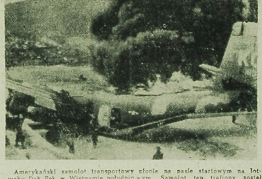
Amerykański samolot transportowy słońce na pale transformacji w lot. Wzrost Dax Paks w Wietnamie południowym. Samolot ten został PRZK. posiadał atakowali się wywołujący. CAF

Przypomnienie tych dat wystarczy dla podkreślenia, że walka będzie krótka, ale zażarta. Przygotowania do niej rozpoczęły się natychmiast, zarówno po stronie nadwerżonej ostatnimi wydarzeniami większość gaulijskiej, jak też po stronie opozycji lewicowej, która stała w szranki w poczuciu siły i bójowości, udowodnionej w potężnym strajku w zakładach na ulicach dziesiątków miast. Jak stwierdza „Le Monde”, „przyszłe starcie stanowić będzie oczywiście nowy etap