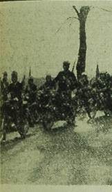
Szafeta szlakem zwycięskiej Armii Radzieckiej i Ludowej Wojska Polskiego, która 18 km. wyruszyła z Białoostoku, na trasie Kętrzyn — Bartoszyce.

HANOI (PAP) — Wietnamska Agencja Informacyjna VNA podaje, że 21 kwietnia rzesyona został przez amerykański samolot typu „F-111”.