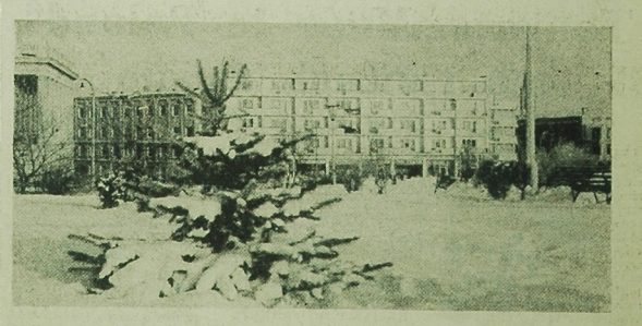
Białystok w zimowej szacie — widok z Parku Centralnego