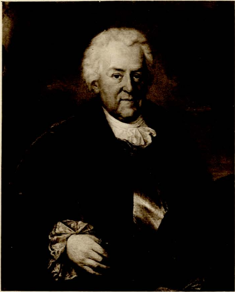
MARCELLO BACCIARELLI Stanisław Poniatowski ojciec króla