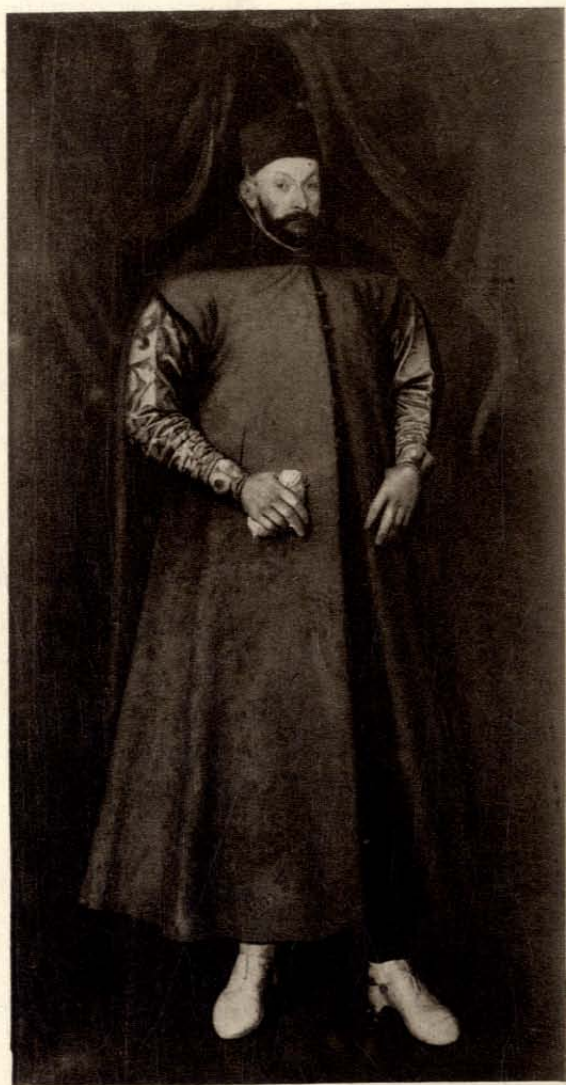
MARCIN KOEBER Król Stefan Batory