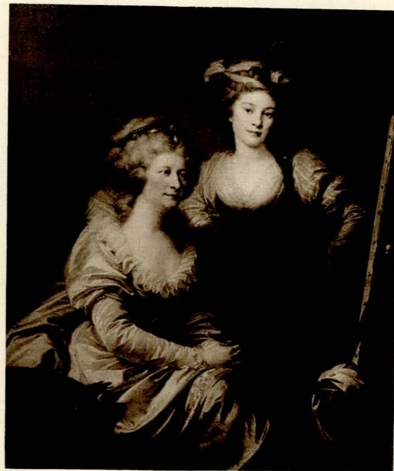
GIOVANNI BATTISTA LAMPI Zofia z Mniszchów Szczęsnowa Potocka z córką