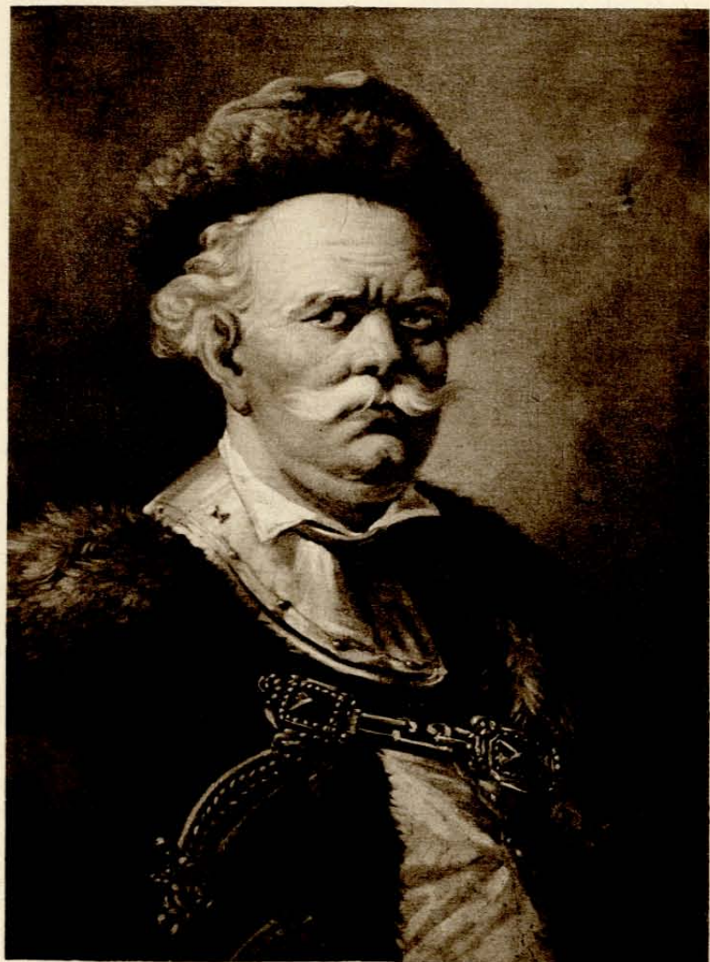
ALEKSANDER ORŁOWSKI Kresowiec