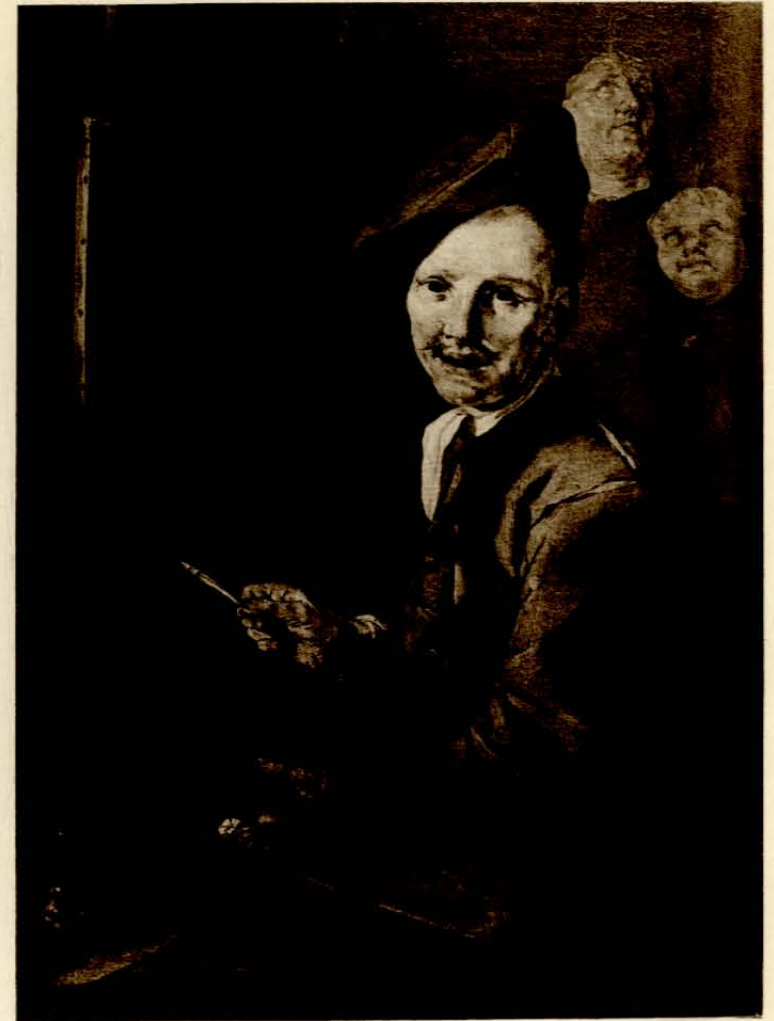
JEAN BAPTISTE CHARDIN