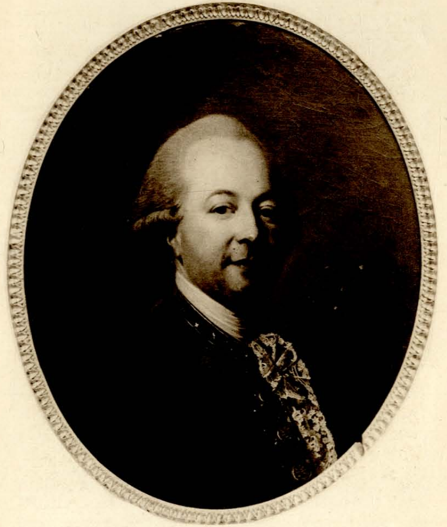
ALEKSANDER ROSLIN Michał Jan Pac, Marszałek Konfederacji Barskiej