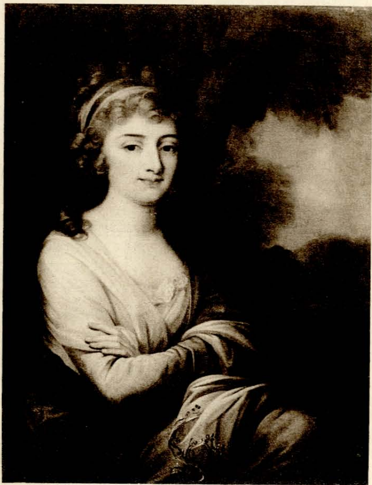
JÓZEF GRASSI Anna z Ossolińskich Krasieńska