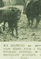
NA ZDJĘCIU: na pierwszym planie jeden z tegoż rocznych cielaków, tu tworzyście dorostłych żubrów.

Nie sprzyja również rozwojowi ruchu racjonalizatorskiego. W tym celu są w drodze do wojewódzkiego sądu.