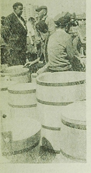
Bezaki na ogórki i kapustę.

Od 11 września br. w Szkole Podstawowej nr 18 przy ul. Stolecznej rozpoczyna się eksternistyczny kurs dla dorosłych obejmujący program szkoły podstawowej. Kurs trwać będzie pół roku. Zajęcia odbywać się będą po południu. Zapisy przyjmuje kancelaria szkoły do dnia 10 września br. (CH)