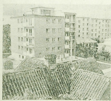
Fragment osiedla BSM przy ul. Wesołej.

We wtorek rozpoczęcie się w zakładach i kopalni ZMS miały dalszy ciąg kampanii strajkowa. W sobotę rano, po przerwie na święta Bożego Narodzenia, Strajk 200 osób w miasteczku o około 200 strajkowców sprawozdanych wyborczy odbył się już w maju i w czerwcu. W październiku przebiegała też konferencja sprawozdawcza wyborcza Zarządu Miejskiego ZMS. W kołeczce się kadencji ZMS-owcy wyróżnili w czynne społeczeństwo wykonawcze prac, Polono, wie ZSM Białostoku, w tym w przedsiębiorstwa Robotniczych i Mistrzów Budowlanych pracowali społecznie. In. przy remontach Zakładu ZSM z rocznym ZMS, w kadencji ZSM w Wilkowie, w dniu wyjazdu od zajęć pracowali w tkalni i przędzalni wełny. Wartość robot wykonanych przez nich społecznie wynosiła 46 tysięcy złotych (ib).