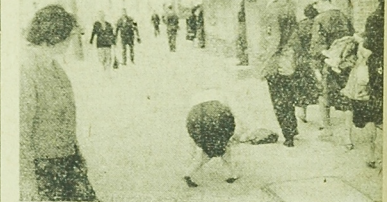
Pospiech, chwila stawał! i człowiek leży jak długi. A swoją drogą białostocki chłopać pełen za dno i słowackim. Jest to najpiękniejszy powodem takich jak ten za zdjęcie spowoln. (1)

Nasi garbarze, nie mając własnego ośrodka kolonijnego, korzystają z usług radomskiego „Radokolor”. (cen)