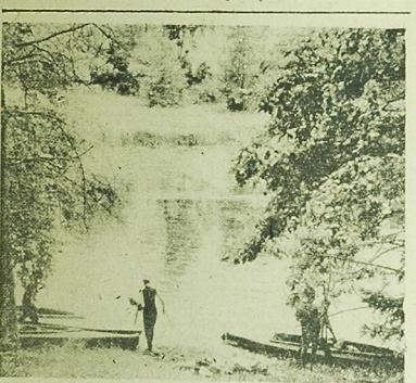
Nad Czarna Hańcza

Włoski automat pończoskowy ZODIAK-8 produkuje pończoski bez szwów o gładkim lub usztywnionym splocie, o nie spadających oczkach. Nowością techniczną są automatyczne urządzenie mechaniczne, które regulują proces zamykania języczków igiel, elektroniczne urządzenie zatrzymujące i pneumatyczne urządzenie do usztywniania oczek. (as)