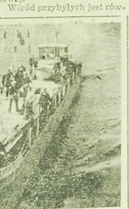
Ward przybyłych jest również...