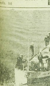
Wracali z delegacji do Wrocławia...