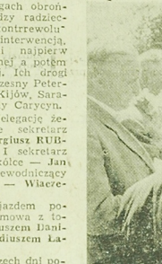
NA ZDJĘCIU: delegację białostocką żegnają harcerzki.