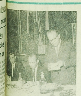
Współpraca RSW „PRASA”

W Suwałkach, położonej daleko od wojennych wydarzeń wojennych Niemcy wzywali do poddania się. W Suwałkach, położonej daleko od wojennych wydarzeń wojennych Niemcy wzywali do poddania się. W Suwałkach, położonej daleko od wojennych wydarzeń wojennych Niemcy wzywali do poddania się.