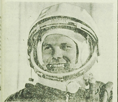
Dzień, w którym pierwszy człowiek na świecie odbył podróż kosmiczną, obchodzony jest jako Dzień Kosmonautyki. Dokładnie sześć lat temu JURIJ GAGARIN (na zdjęciu) dokonał w statku kosmicznym „Wostok” pierwszego rakietowo-satelitarnego lotu, w czasie którego jeden raz okrążył glob ziemski.

Zachmurzenie umiarkowane, możliwe lokalne burze i przelotne opady. Temp. ok. 20 st. C. Wiatry słabe południowo-wschodnie 1-2 m/s.