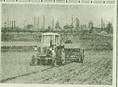
Góry Śląsk — obok wielkich zakładów przemysłowych tu Nowej Rudzie rozciągają się pola PGR-u. Nowa Ruda.

Wyjdzie się, że duże trudności kadrowe sprawiają ten system plac. Chodzi o taryfikację plac, który powinien być jednolity we wszystkich resortach i na terenie całego kraju. Może skończyć się podjęciem walki za lepszymi warunkami i uposażeniem, a może się sprawa w wypadkach awansów. Otóż awans wynikają z zdobytych dodatkowych kwalifikacji, a nie wyników powodów obniżenia zarobków awansowanego (np. z robotnika na maistra). W naszym kierownictwie nie zarobić więcej aniżeli ludzie mi indywidualni podlegli. Bardzo często spotykamy zarobki kierowników, którzy mianowany na określone stanowisko fachowiec posiadający wprawdzie ogólne wykształcenie techniczne, lecz nie są szerzej zorientowani w związkach z tym stanowiskiem. Dlatego każde stanowisko powinno być atchodzone dopiero po odpowiednim przeszkoleniu kadry. Czy więc nie należałoby pomyśleć o pewnego