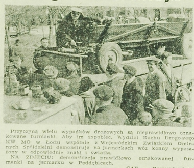
Pracująca w celu zarobku w fabryce, Wydział Ruchu Drogowego...

„Nasza najwzjańska chluba jest wierność, wierność ojczyźnie, która rozlega się od Renu do Klajpedy...”