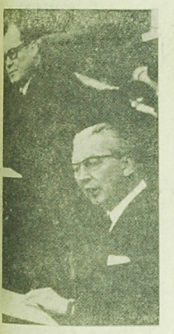
Kwot mianowany kandydat NRP — Kari Gode Kiesinger, poddany odezwaniemu deklaracji... wybrze politykę rządu Niemiec na najbliższe trzy dni.

LONDYN (PAP) — Dwóch robotników poniosło śmierć a zostało ciężko rannych w wyniku eksplozji w fabryce metalowej, jaka wydarzyła się w środę w pobliżu Bilbaw. Przyczyną katastrofy nie są znane.