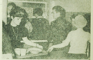
NA ZDJĘCIU: porządek obowiązuje w stołówce, nawet i studenci. Blada tena, kto by spróbował otrzymać posiłek poza kolejką.

Odziennie stołowa biłostockiej AM wydaje setki posiłków dla słuchaczy tej uczelni. Smacznie i obficie posiłek cieszą się dużym uznaniem. Nad pracą stołowej czuwają przedstawiciele studenckiego samorządu — członkowie komisji stołkowej.