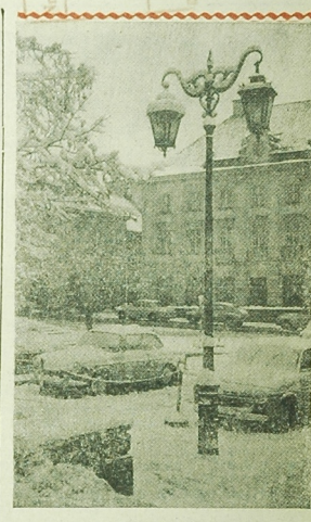
Warszawski Rynek Nowego Miasta to zimowej szacie.

W grupie miast zamierzonych przez ponad 5 tysięcy mieszkańców postanowiono nie przyznawać nagrody, lecz dwie równorzędne nagrody drugie w wysokości 150 tysięcy zł dla Augustowa i Olecka, nagrody trzeciej w wysokości 100 tys. zł przyznając Białskowi Podlaskiemu.