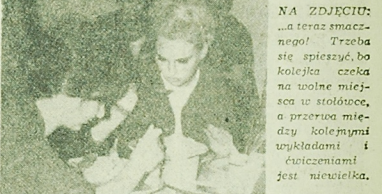
NA ZDJĘCIU: „...a teraz smacznie! Treba się spieszyć, bo kolejka czeka na wolne miejsce w stołówce, a przecież między kolejnymi wykładami i ćwiczeniami jest niewiele.” (h)