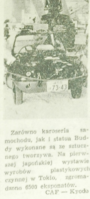
Zarówno karoseria samochodu, jak i statusa Buddy wykonane są ze sztucznej tworzywa. Na pierwszym japońskiej wystawie wyrobów plastycznych, czynnej w Tokio, zgromadzono 6500 eksponatów. CAF — Kyoto

Lanczychy z tworzyw sztucznych zdobywają sobie coraz większą popularność. Oats nie tylko z firm w Szwajcarii opracowała urządzenie do produkcji jednych odcinków lanczych, a nie po poprzednich etapach.