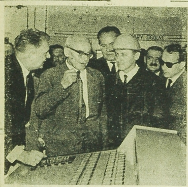
NA ZDJECIU: grupa przedstawicieli kombinatu. Przy pulpicie sterowozem Wł. Gomułka słucha objadniętych przedstawicieli zakładu.