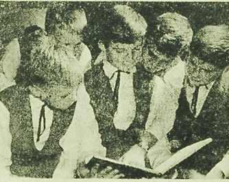
NA ZDJĘCIU: najmłodsi członkowie Chóru w przerwie koncertu.

Chłopców koncert w klubie widowiskowo-koncertowym „Sztuka” w Bydgoszczy zorganizował w Wydziale Kultury Prez. MRN i Klubu Związków Zawodowców. Dzięki o tym namawianiu, odmiennych w Leninogrodzie (w Festiwalu „Białych nocach” w Rydze, Tallinie i Wilnie. Wszędzie tam przymiłowani byli niezwykle gorąco. Ich koncerty transmitowane były przez radio i telewizję. Wracali podnieceni nowymi wrażeniami, spieszyli się do Poznania po dość długiej nieobecności, a mimo to, zatrzymali się na drodze w naszym mieście. Wszak ich