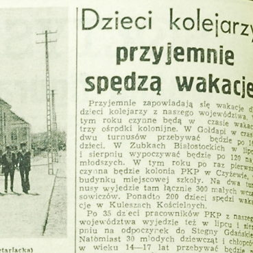
Osiedle ZOR (ulica Proletariacka)

W tym czasie 150 osób ukończyło szkołę podstawową, 100 osób szkołę średnią, a 50 osób szkołę wyższą. W tym czasie 150 osób ukończyło szkołę podstawową, 100 osób szkołę średnią, a 50 osób szkołę wyższą.