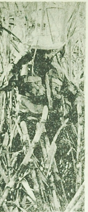
NA ZDJĘCIU: premier Kuby — Fidel Castro podczas tegorocznej „trawy”.

W tych dniach zakończy się na Kubie wielkie żniwa trzciny cukrowej, w których tradycyjnie już we dwoje udział wzięli przedstawiciele władz państwowych i państwowych, w tym roku narodowi kubańscy już po raz szósty od zakończenia rewolucji socjalistycznej uczestniczą w zbiorach trzciny cukrowej plantacjach w ekich gospodarstwach państwowych.