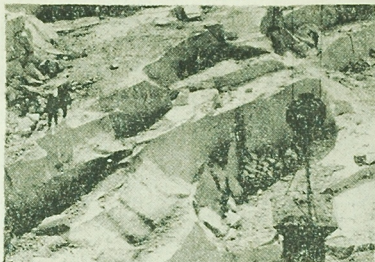
Kolo Strzegomia (woł. wrocławskie) znajdują się wielkie pokłady kamienia granitowego, eksploatowane przez Zakład Kamienia Budowlanego. W kamieniołomach wydobywa się bloki o różnych wymiarach i ciężarze do 10 ton, które obrabiane są na potrzebne elementy. Ze strzegomskiego granitu powstają m. in. wazy, kolumny, posątki — słynna Kolumna Zygmunta i Płenna Kolonna Polskiego — projektowany przez Xawerego Dun kownięca. W tym kamieniołomie: wydobywane bloki w kamieniołomach strzegomskich.