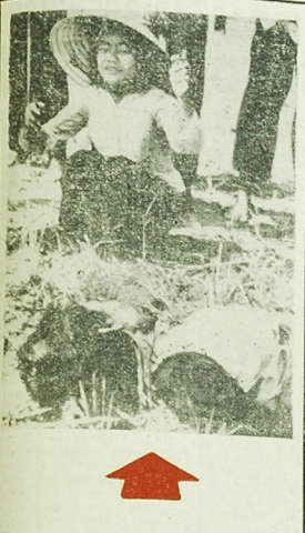
Wietnamskie dziecko płacze na ciele matki z polud nitowym. Wietnamska matka z dzieckiem szła drogą w pobliżu Tay Hoa, około 500 km na północ od Sajgonu.