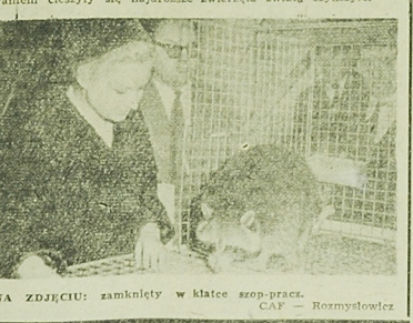
NA ZDJĘCIU: zamknięty w klatce szop-prace.

produkcja byłaby oparta na przetworstwie drewna. Coraz większy udział w eksporcie posiadają maszyny i urządzenia produkowane w białostockich zakładach metalowych. Eksport tych wyrobów w milionowym pięcioletku wzrósł dwukrotnie. Szczególnie duże osiągnięcia, posiada tutaj Fabryka Przyrządów i Urządzeń, której wyroby cieszą się dużym popylem nawet w wysoko uprzemysłowionych krajach. Wydaje się, że o podjęciu produkcji eksportowej powinny pomyśleć także drobne zakłady metalowe.