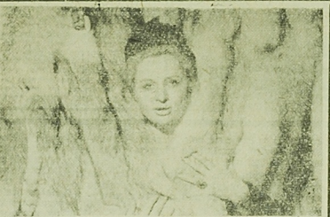
NA ZDJĘCIU: modelka wśród eksponowanych na wystawie li-chińskich futerk.

NIE SPOCZYWAĆ NA LAURACH Czy posiadamy realne możliwości intensyfikacji produkcji eksportowej na Białostoczczynie? Wydaje się, że należąca odpowiedzialność na to pytanie może być nasz dotychczasowy dorobek w rozwijaniu produkcji eksportowej, zwłaszcza osiągnięcia uzyskane w minionym pięcioletku. Planowe zadania w dziedzinie tradycji eksportowej na ogół realizowaliśmy terminowo i często z dużymi nadwyżkami. W latach 1961-1965 wartość produkcji eksportowej w woj. białostockim