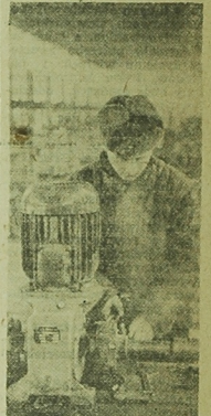
W lipcu bieżącego roku rozpocznie prace jeden z największych zakładów polskiej metalurgii kolorowej — huta aluminium w Koninie. NA ZDJĘCIU: montaż urządzeń podziemnych anod.

Jednakże zrealizowanie planów telekomunikacyjnych zależy w równej mierze od resortu łączności, jak i resortów z nim współpracujących. Tymczasem zastrzeżenia budzi zarówno ilość, jakość i terminowość urządzeń telekomunikacyjnych w kraju, jak też i terminowość oddawania do użytku nowych obiektów telefonicznych przez resort budownictwa. (AR)