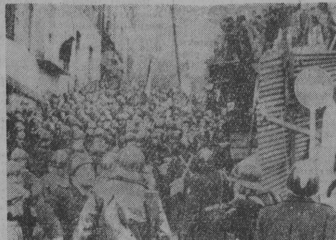
Silne oddziały policji usiłują rozproszyć demonstrującą ludność muzułmańską w Algierze.