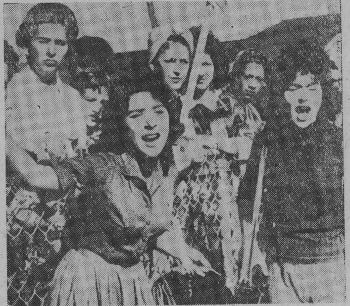
Nowy Orlean, stolica stanu Luizjana, jest w dalszym ciągu widownią zaistej demonstracji przeciwko wprowadzeniu w życie podjętych 6 lat temu przez Sąd Najwyższy USA, postanowień o integracji szkół. Jak wiadomo, ekscesy rasistowskie w Nowym Orleanie zostały wywołane przyjęciem do dwóch szkół podstawowych czterech 6-letnich dziewczynek murzyńskich.

NA ZDJĘCIU: fragment demonstracji zwolenników segregacji rasowej w Nowym Orleanie. Postaw starszej generacji jest różnie wymowna jak okrzyki młodych rasistek.