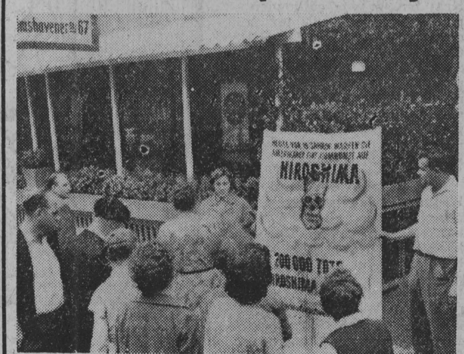
W XV rocznicę Hiroszimy młodzież PZP zainicjowała warty przedmiotowe w zachodnim Berlinie. NA ZDJĘCIU: jedna z wart przed halą targową w okręgu Tiergarten.