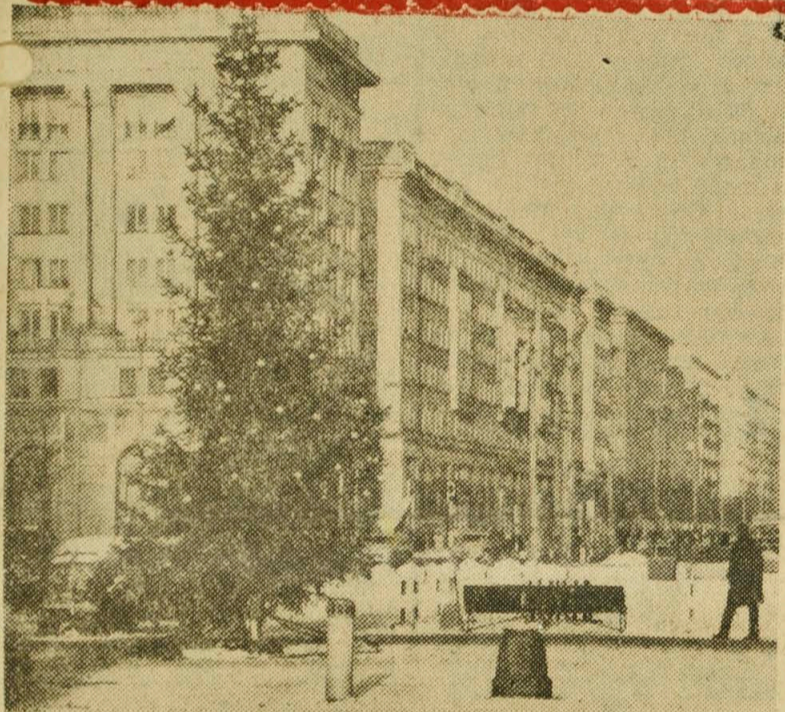
Stolica przygotowuje się do powitania Nowego Roku. NA ZDJĘCIU: choinka na Placu Konstytucji w Warszawie.

Premier Souvanna Phouma zapewnił dziennikarzy, iż zrobi wszystko co w jego mocy, aby doprowadzić do pomyślnych wyników spotkania trzech książąt.