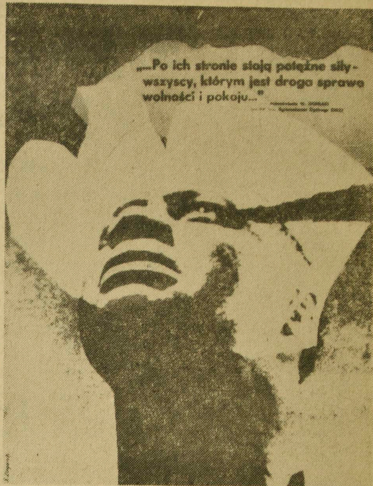
„Po ich stronie stoją potężne siły — wszyscy, którym jest droga sprawa wolności i pokoju...”

Pierwszy zastępca przewodniczącego Rady Ministrów ZSRR, Anastas Mikojan odwiedzi Republikę Gwinei na początku stycznia 1962 r. Rząd radziecki podjął decyzję w sprawie wizyty Mikojana w związku z zaproszeniem przesłanym przez szefa rządu Republiki Gwinei. Mikojan uda się do Gwinei w celu przeprowadzenia rozmów dotyczących zacieśnienia współpracy między Gwineą a ZSRR.