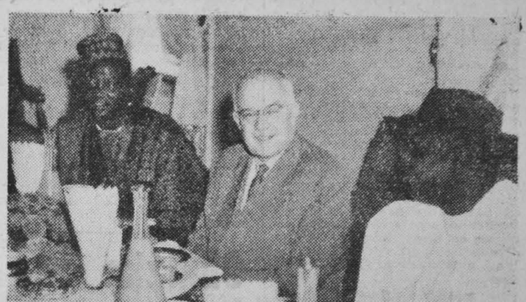
13 bm. z-ca przewodniczącego Rady Państwa prof. dr Oskar Lange przyjął w Belwedrze delegację rządową Nigerii z przewodniczącym delegacji ministrem Finansów Federalnego Rządu — F. S. Okotie Eboh.

Władze francuskie wysłały do Bretanii poważne siły policyjne.