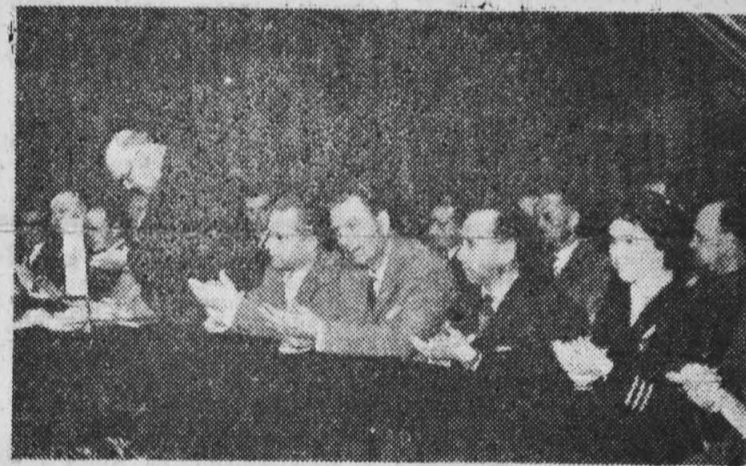
Prezydium akademii.