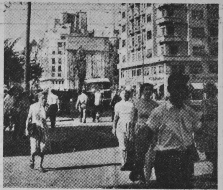
NA ZDJĘCIU: na bulwarze Balcescu — jednej z głównych arterii Białostoku.