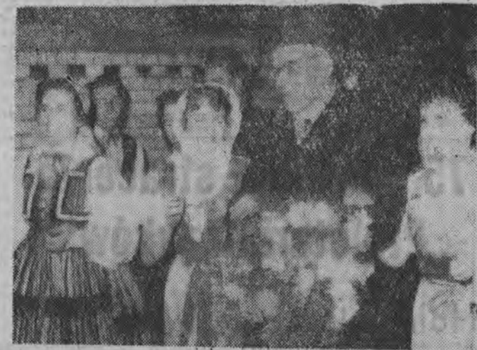
28. I. 1961 r. przybył na Śląsk na uroczystości 40-lecia Związku Chemików I sekretarz KC PZPR WŁADYSŁAW GOMUŁKA.

NA ZDJĘCIU: owacyjne powitanie Władysława Gomułki na dworcu w Katowicach.