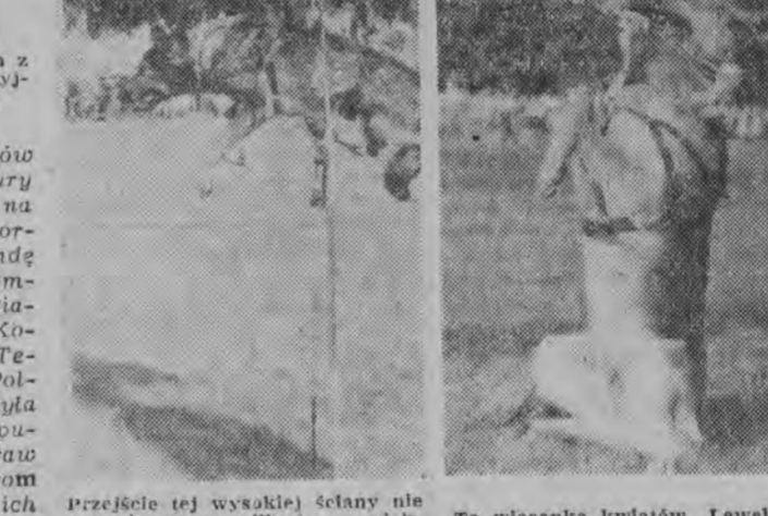
Przejęcie tej wysokiej ściany nie sprawia psemu milijonowi większej trudności.