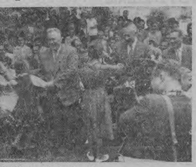
19. VII. br. członkowie partyjno-rządowej delegacji ZSRR w towarzystwie...