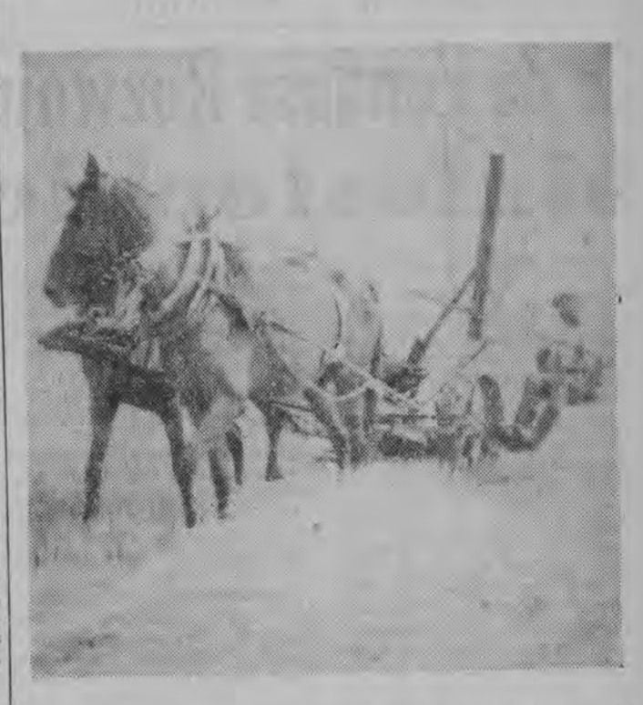
W Rzeszynie (pow. Białostocki) robotnicy mają kilka własnych żniwiarzy. Maszynę stała w miejscu, wzdłuż do sąsiada do tygodnia będzie sprzątał owies.