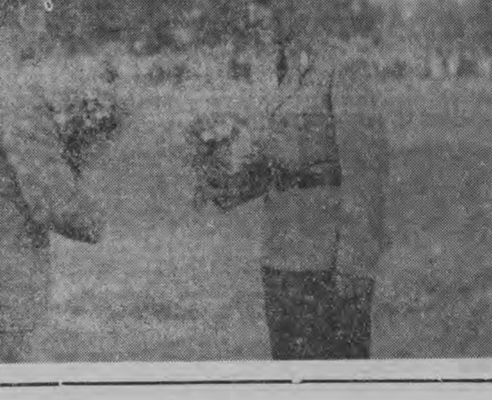
W poprzednim numerze „Głosu Pracy” podaliśmy wiadomość, że siedem Zakładów Chemicznych „Oświeceni” jest podobno najstarszym osiedlem w Polsce...