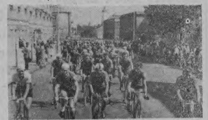
NA ZDJĘCIU: kolarze tuż po starcie honorowym. Jadą jeszcze dużą zwartą grupą.