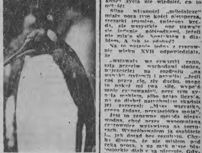
Pingwiny z ZOO w Vincennes (Francja) chłodzą się chętnie w czasie upałów pod specjalnie dla nich zainstalowanym przysnkiem.