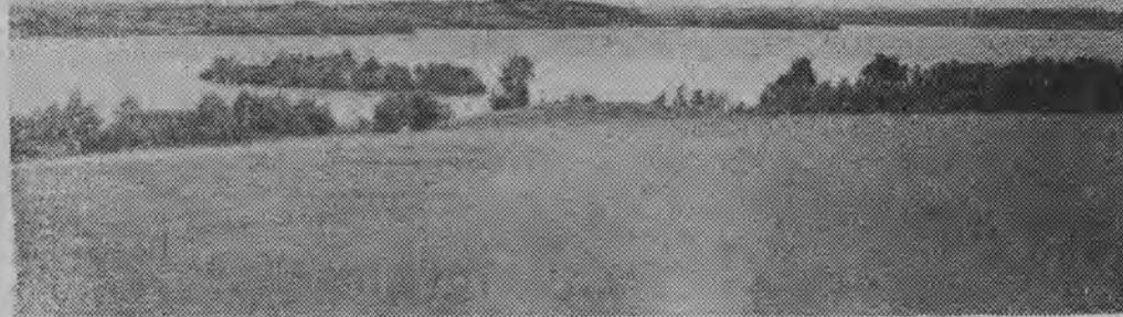
Przed nami przepyszna tafla jeziora Galadus z urozmaiconym brzegiem i uroczymi wyspami.

Eyl to chyba najprzyjemniejszy wyjazd w naszej sporterskiej praktyce. Wszystko zaczęło się od tego, że przed kilkoma dniami zwrócił się do redakcji przewodniczący Prezydium Powiatowej Rady Narodowej w Sejnach tow. Łazarowicz z prośbą: przyjeździecie, zobaczcie i napiszcie. Po trzech dniach bliźniaczej w Sejnach. Stąd ruszyliśmy redakcyjną „Warszawą” w długi rejs po najpiękniejszych zakątkach Kraju 130 jezior. W powiecie sejneńskim są 132 jeziora. Wynika z tego, że prawie każda leży nad jeziorem.