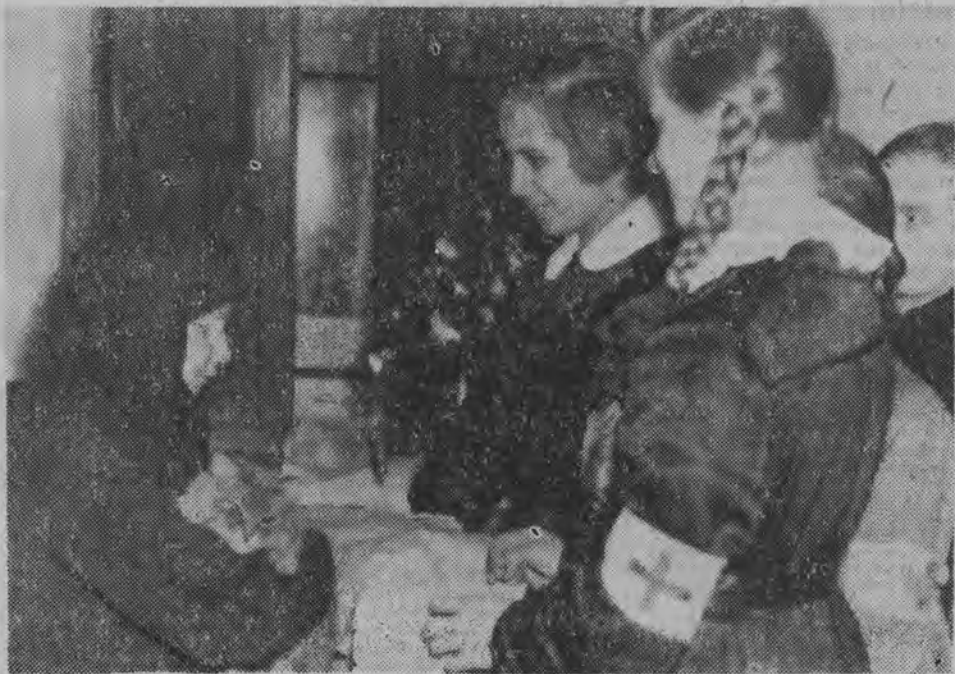
Tej starszeczce szkolne koło PCK przy Szkole Podstawowej nr 15 w Białymstoku zorganizowało choinkę.

Na podstawie kartotek, od zakończenia wojny do chwili obecnej, biuro ustaliło jakie są losy 445.099 osób poszukiwanych przez rodziny.