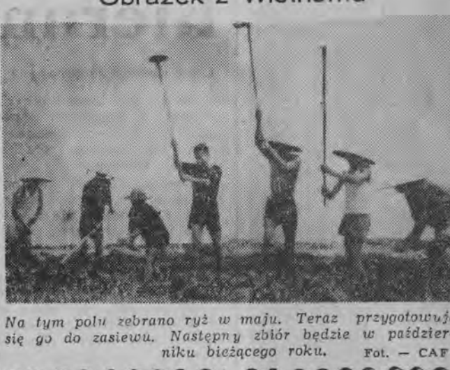
Na tym polu zbrano ryż w maju. Teraz przygotowują się go do zastawu. Następną zbiór będzie w październiku bieżącego roku.