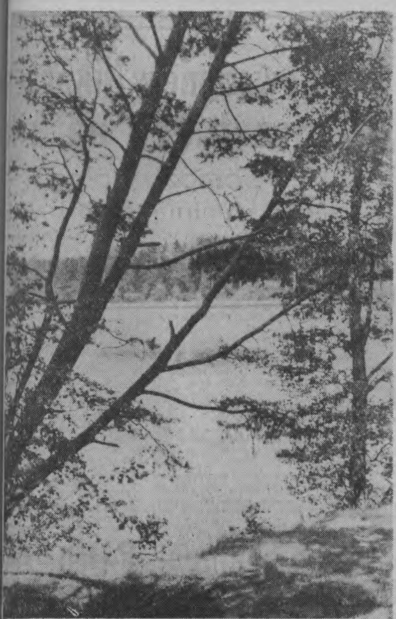
O krainie 130 jezior — czytaj na str. 6

Proletariusze wszystkich krajów, łączcie się!