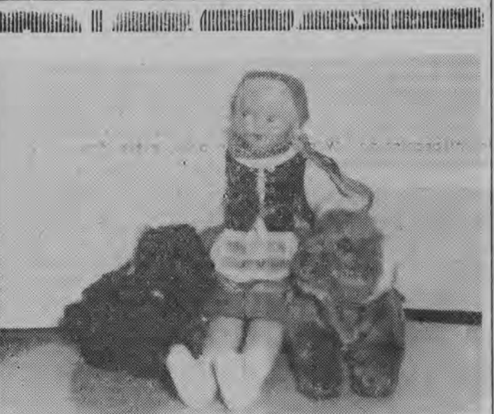
Takie ekspozycje wysłano na międzynarodowe wystawy Czerwonych Krzyży w Kanadzie i Irlandii. Wykonawcy: kółka PCK przy szkołach nr 10 i 15 w Białymstoku.

Uwaga uczestników konferencji generacji zwrócić uwagę, w jaki sposób reklamujemy się w miejscach wycieczki. Napisz zachęcający do kupna powiększonego zdjęcia. Powiększając samą swoją rodzinę”.