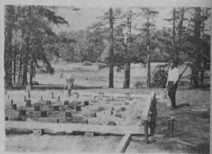
Nad jeziorem Pomorze Walcownia Stali „Warszawa” buduje już ośrodek kampingowy. Warszawiacy wybrali na prawdziwe uroczysko.

Białostockie Przedsiębiorstwo Obrótu Nałozami „Centrala Nałozami” w Białymstoku poszukuje kandydata na kierownika Zakładu Czystości Nasion w Elku i kierownika Inspektoratu w Białymstoku. Wymagane kwalifikacje: 1) na kierownika Zakładu Czystości Nasion: wyższe wykształcenie techniczne lub ekonomiczne oraz 7 lat praktyki w następnym: 2) na kierownika Inspektoratu: wyższe wykształcenie techniczne lub ekonomiczne oraz 3 lata praktyki w następnym: 3) na kierownika Inspektoratu: wyższe wykształcenie techniczne lub ekonomiczne oraz 7 lat praktyki w następnym.