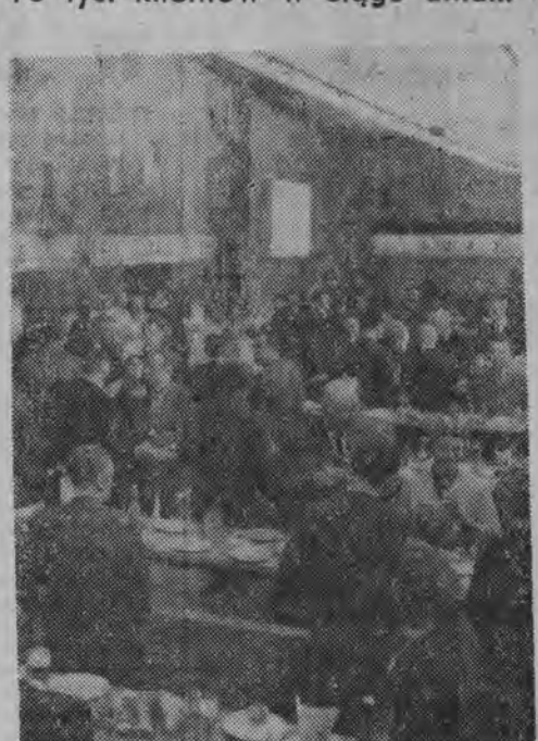
...może obsłużyć wielki samoobsługowy bar „Praga” w Warszawie otwarty w dniu 6 marca br.