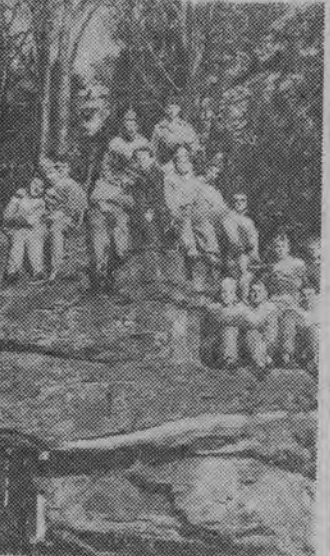
NA ZDJĘCIU: piłkarze „Tura” na obozie w Szklarskiej Porębie.