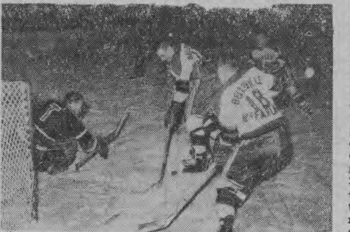
NA ZDJĘCIU: fragment meczu Kanada — NRF 7:0.

Najtrudniejszym rywalem Kanady będą zapewne gospodarze mistrzostw. Chcąc zaprezentować się przed własną publicznością z jak najlepszej strony Cześć przygotowali się do tej światowej imprezy szczególnie starannie. Sensacyjnie moskiewskie zwycięstwo ekipy CSR nad Związkiem Radzieckim 2:1 oraz wygrana 3:2 reprezentacji młodzieżowej CSR również z pierwszym garniturem ZSRR czynią z Czechów „czarnego konia”, cichych faworytów praskich mistrzostw. W ub. czwartek kadra CSR, występująca pod firmą Pragi, wygrała z USA 8:3.