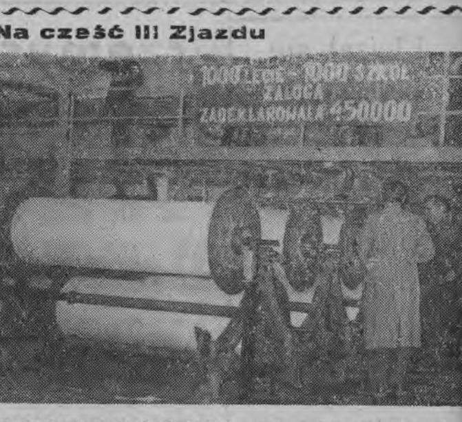
Na cześć III Zjazdu