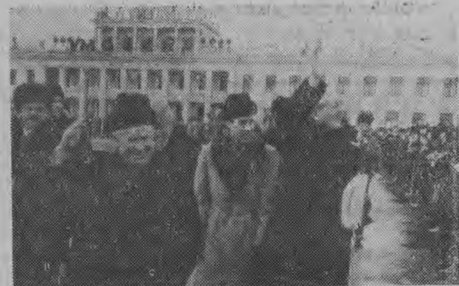
Owacja ludności Moskwy na lotnisku Wnukowo na cześć przybyłego z Londynu premiera H. Macmillana oraz N. S. Chruszczowa.