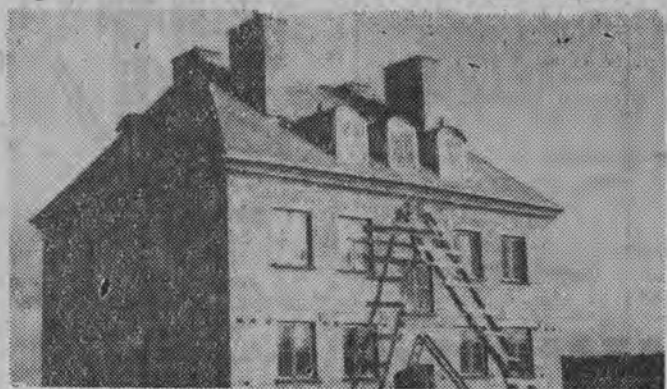
To już drugi z kolei blok mieszkalny zbudowany swoim pracownikom przez Państwowy Ośrodek Maszynowy Smolniki koło Stawisk.