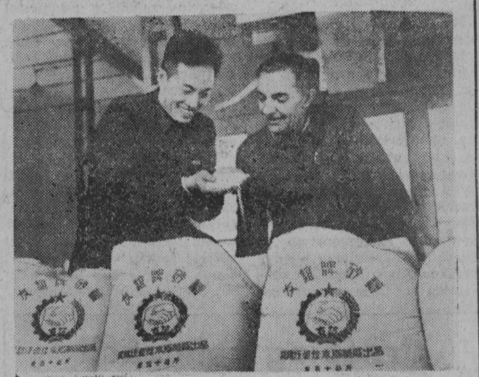
W ostatnim czasie ruszyły w Chinach cukrownie, których projektów i wyposażenia dostarczyła Polska w ramach umowy handlowej w latach 1954 — 1955. Jedną z tych cukrowni w miejscowości Kiamusze będzie produkowała 10 tys. ton cukru rocznie.

Z okazji zdobycia pierwszego miejsca odbyło się 11 bm. w Bielsku - Podlaskim uroczyste wręczenie proporcja przewodniczącego Zarządu Wojewódzkiego ZMP w Białymstoku, przodującemu kołu ZMP przy POM w Bielsku - Podlaskim. Na uroczystość tę przybyli licznie młodzi traktorzyści z POM w Baci-