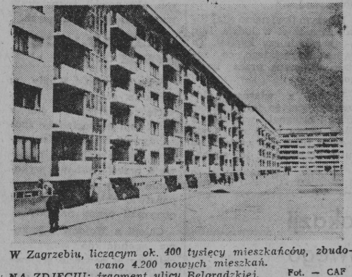
W Zagrzebiu, liczącym ok. 400 tysięcy mieszkańców, zbudowano 4200 nowych mieszkań. NA ZDJĘCIU: fragment ulicy Belgradzkiej.

Było to w latach hitlerowskiej okupacji. Jugosławię znajdowała się w ogniu walki narodowo-wyzwoleńczej. 29 listopada 1943 r. w małym bośnickim miasteczku Jasku zebrało się ze stu na stu sesji Antyfaszystowskiego Zrzeszenia Wyzwolenia Narodowego — AWWNO. Wyrażając wolę narodu, podjęli oni przelomowe dla historii kraju uchwały. Utworzono Komitet Wyzwolenia Narodowego o uprawnieniach rządu tymczasowego. Postanowiono, że nowa Jugosławię będzie zbudowana na zasadach federacji równoprawnych narodów i państw: Serbii, Chorwacji, Słowenii, Macedonii, Czarnogóry oraz Bośni i Hercegowiny. Założono fundamenty demokracji i federalnego ustroju nowej państwowości. Tak narodziła się w latach wojny Federacyjna Republika Jugosławi. Po dwóch latach, 29 listopada 1945 r. — otwarta została pierwsza sesja Konstytuanta, na której proklamowano utworzenie Republiki Jugosławijskiej.