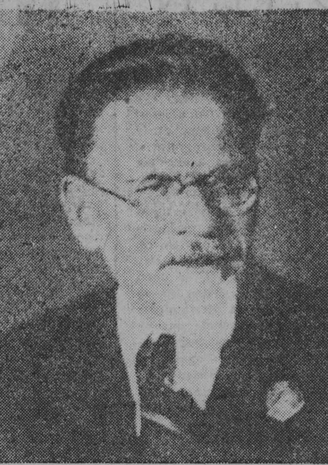
W bieżącym roku, 19 listopada, mija 80 rocznica urodzin wielkiego bojownika o sprawę klasy robotniczej — Michała Kalinina. Artykuł o życiu i działalności Kalinina czytaj na stronie 3.