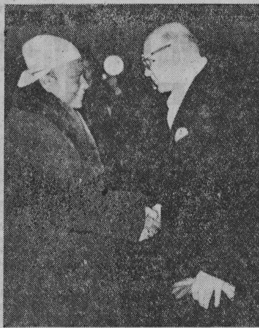
Premier Burmy U Nu po wizycie w ZSRR i krótkich odwiedzinach w Finlandii, Szwecji i Danii wkrótce przybędzie do Polski. NA ZDJĘCIU: premier Finlandii Kekkonen wymienia uścisk dłoni z premierem U Nu.

LONDYN. — Agencja Reutersa donosi, że sytuacja na Cyprze jest w dalszym ciągu napięta. Wojska brytyjskie zakończyły swą akcję w północno-wschodniej części wyspy. W działaniach wzięło udział około 1700 żołnierzy, samoloty i helikoptery. Oficjalny komunikat brytyjski twierdzi, że wojsko wytopiło szereg kryjówek bojowników EOKA.